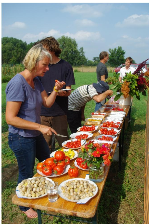
Verkostung ökologisches Freilandprojekt; Foto: B. Horneburg

Vereinheitlichung ist das Gegenteil von dem was wir brauchen, um die großen Zukunftsaufgaben zu bewältigen. An Stelle weniger Kulturpflanzen und weniger Sorten mit großer Verbreitung benötigen wir eine große Vielfalt. Wir benötigen nicht nur Sorten für fruchtbare Regionen, sondern auch solche, die auf ärmeren Böden und unter schwierigen Klimabedingungen gute Erträge liefern. Nur so wird es gelingen, die Landwirtschaft an den Klimawandel anzupassen und Ernährungssicherung zu erreichen. Auch brauchen wir Sorten, die weniger auf chemischen Pflanzenschutz angewiesen sind, indem sie die jeweiligen standortspezifischen ökologischen Potentiale optimal zu nutzen. Auf diese