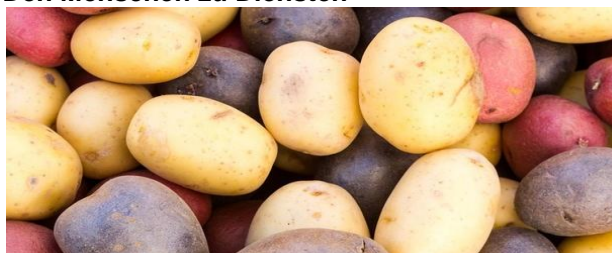
Kartoffelvielfalt; Foto: www.transgen.de

Die traditionelle Agrarforschung verfolgt das Ziel, genügend Nahrungsmittel für eine wachsende Weltbevölkerung bereitzustellen. Das ist legitim, denn Hungersnöte waren und sind eine schlimme Geissel. Dank der Agrarforschung wurden Ernteausfälle reduziert und die Produktion erhöht. Dabei definierte aber der Mensch, welche Arten und Sorten nützlich sind. Und umgekehrt entschied der Mensch auch, welche Pflanzen oder Tiere überflüssig und welche gar schädlich sind. Er unterzog die Biodiversität einer ökonomischen Kosten-Nutzen-Rechnung. Dass aber bekämpfte und ausgerottete Schädlinge eine Aufgabe im Ökosystem haben, drang erst langsam ins