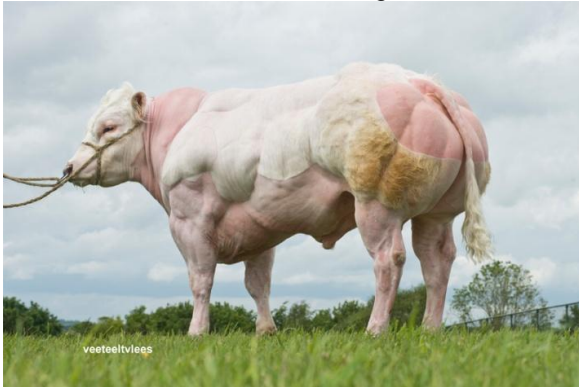
Belgian Blue Bulle; Foto: http://masterrind.com/bull/faucon

Die Menschen haben die Anzahl der Sorten durch Züchtung massiv erhöht. Es gibt tausende von Mais-, Weizen-, Reis-, und Kartoffelsorten. Doch moderne Pflanzen- und Tierzucht ist immer häufiger marktgetrieben. Der Fokus liegt auf den produktivsten Sorten und weniger auf anderen Qualitätskriterien. Deshalb nimmt trotz dieser grossen Auswahl die Vielfalt auf dem Acker ab. Die konventionelle Forschung stösst an Grenzen. Die Erträge können durch Züchtung nicht mehr beliebig gesteigert werden. Extreme Züchtungen bei den Nutztieren, beispielsweise bei Hühnern oder Truthähnen, führen zu so schweren Tieren, dass sie sich ohne menschliches Eingreifen nicht mehr