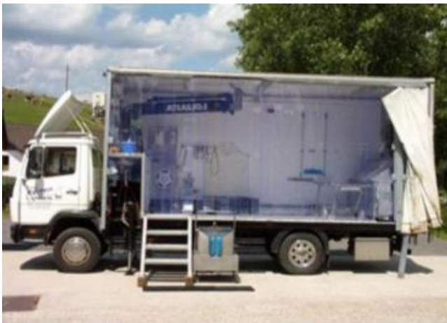
Mobiler Metzger

Die Schlachtung von Nutztieren ist ein Schwerpunkt in den Diskussionen über das Wohlergehen von Nutztieren. In den Medien werden konventionelle Schlachthöfe immer wieder kritisiert. Weniger bekannt ist die Tatsache, dass auch Halter und Züchter die gängigen Praktiken kritisieren. Besonders für Landwirte, die kurze Lieferketten und Direktvermarktung anwenden, stehen Schlachthöfe nicht im Einklang mit ihrer Haltungphilosophie. Weder für den Tod der Tiere noch gegenüber der Kundschaft können Sie die volle Verantwortung übernehmen. Viel lieber möchten diese Produzenten die Kontrolle über die ganze Lebensspanne des Tieres haben.