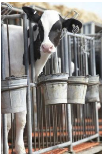
Holstein Friesian; Photo: http://cattleinternationalseries

Mit der Unterstützung von 590 Spendern kamen bei der „Stichting Zeldzame Huisdierrassen“ (SZH – Stiftung für seltene Nutztierassen) in vier Tagen in einer Crowdfunding-Initiative 16.000 € zusammen, um Hunderte von Rindern traditioneller Rassen vor dem Schlachthof zu retten. Die SZH stellt fest, dass seltene Rassen nicht mit Hochleistungs-Kühen vergleichbar sind. Sie sollten von der Beschränkung freigestellt werden und damit ihr Wert für die biologische Vielfalt anerkannt werden. In den Niederlanden gibt es sieben traditionelle Rinderassen, die von Kleinbauern in Mutterkuhhaltung gezüchtet werden.