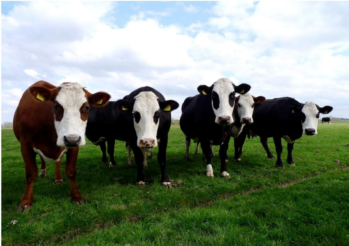
Der Groninger Blaarkop wird wegen seiner Zeichnung im Volksmund auch „Polderpanda“ genannt.