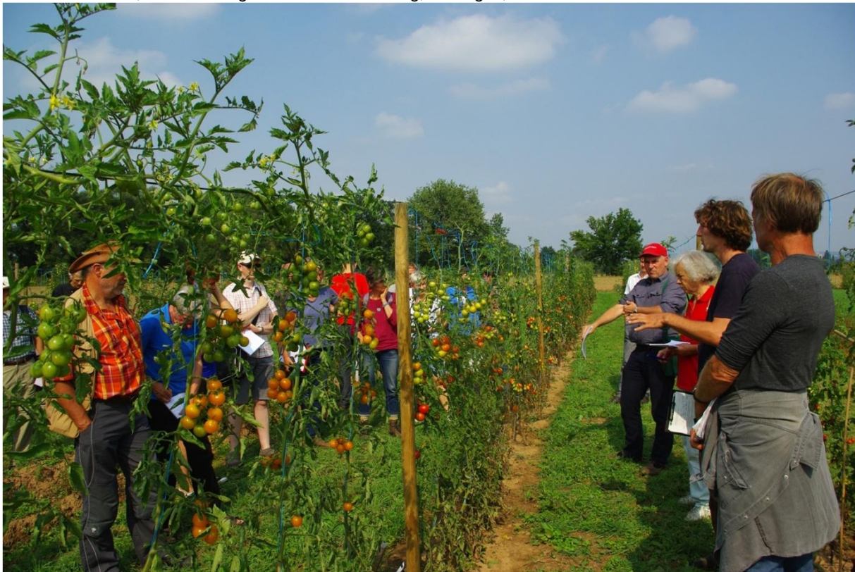
Das ökologische Freiland Tomaten Projekt