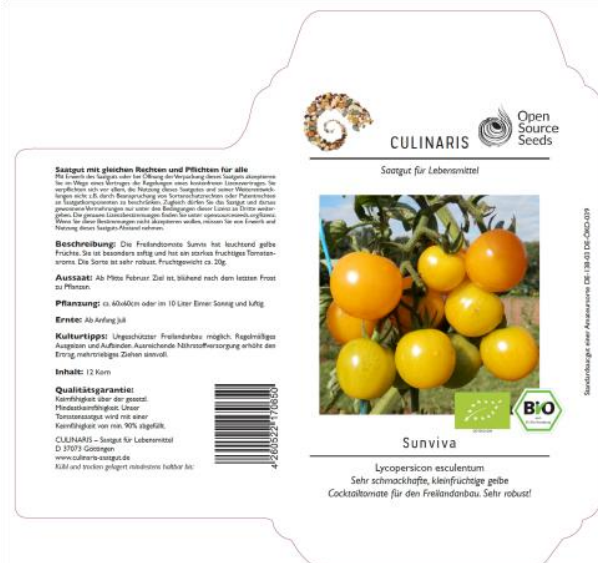
Saatguttüte Tomate Sunviva

Die Cocktail-Tomate Sunviva wurde als erste – aber bereits nicht mehr einzige – Sorte mit der Open-Source Saatgut-Lizenz ausgestattet. Sunviva wurde gemeinschaftlich im Netzwerk des ökologischen Freiland-Tomatenprojekts gezüchtet, das 2003 an der Universität Göttingen als partizipatives Züchtungsprogramm gestartet wurde und die gesamte Wertschöpfungskette umfasst. Es basiert auf dem freien Austausch von Wissen und Tomaten-Genotypen und dient der methodischen Verbesserung der ökologischen Pflanzenzüchtung (Hornburg 2010). Zuchtlinien werden in vielen Gärten, Gärtnereien, Forschungs- und Beratungseinrichtungen getestet und selektiert. Die hier entwickelten Tomaten sind an harte Bedingungen im Freiland angepasst und haben eine verbesserte Feldresistenz gegen die Kraut- und Braunfäule ( Phytophthora infestans ).